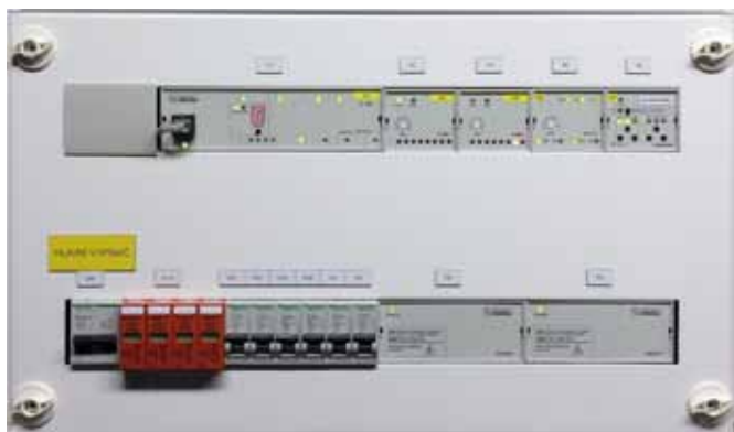
Obr. 4 Centrální jednotka Foxtrot (s červenou segmentovkou a připojením na LAN) v rozváděči společně s jističi a přepětovými ochranami

využívání energie, ať už se jedná o energii v podobě tepla nebo elektřiny. Pracují s akumulačními nádržemi, tepelnými čerpadly, elektrickými akumulátory. Ve svém hledáčku mají např. majitele solárních elektráren na rodinných domech, kde se setkávají dosud s minimální, nebo dokonce žádnou mírou automatizace, která by umožnila elektrickou energii smysluplně zužít a přinést tak majiteli další zisky v podobě snížených nákladů na nákup např. plynu pro vytápění nebo elektřiny od distributora.