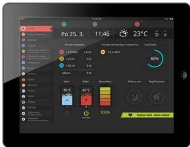
Obr. 2 Přehledová stránka energetiky domu nahlížená z tabletu – součást vestavěného programovatelného web rozhraní Foxtrotu

Pro lepší využití solární elektřiny se objevily různá specializovaná zařízení. Např. k ohřevu vody se vyrábí specializované bojler s topnými tělesy optimalizovanými na stejnosměrné proudy a napětí a s lokální logikou natápění. Na trhu se dále po „jednoduchých“ klasických měničích pro fotovoltaické elektrárny objevují i hybridní měniče, které se připojují mezi distribuční síť, lokální domovní síť, fotovoltaické panely a sadu akumulátorů. Poslední typy hybridních měničů mají dokonce již akumulátory vestavěné. Tyto měniče jsou dodávány již přednastavené na určitou logiku přepínání mezi jednotlivými zdroji a bateriemi. Ne vždy však tato logika odpovídá konkrétním potřebám provozovatele.