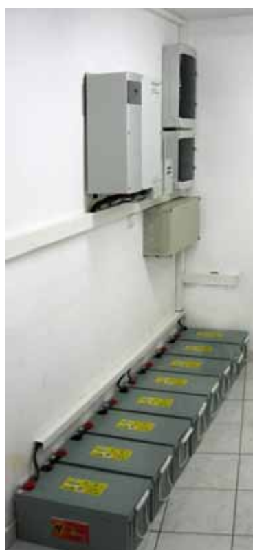
Obr. 3 Akumulátorovna rodinného domu; literatura uvádí, že budoucí optimální akumulací kapacita pro rodinný dům bude okolo 10 kWh

Kombinace provozu termických solárních panelů, plynových kotlů, krbů, ventilací s rekuperací, tepelných čerpadel, provozu bazénů, automatických závlah aj. jsou dnes v domě již tak složité a vzájemně se ovlivňující, že jejich koordinace domácí centrálou s dostatečným výpočetním výkonem se stává nezbytnou nutností. Také samotné provedení elektroinstalace se stává složitější a má svá specifika. Elektrické okruhy je třeba navrhovat a rozlišovat na zálohované a nezálohované. Je třeba počítat i s odpojováním a přepojováním částí instalace od hlavní distribuční sítě. Pracuje se s vysokými stejnosměrnými proudy, zejména při připojování akumulátorů a měničů. Také je třeba např. pečlivě volit jisticí prvky, protože mj. střídače z fotovoltaiky nebo akumulátorů neposkytují příliš vysoký zkratový proud nutný ke správnému vybavení spouště jističe apod.